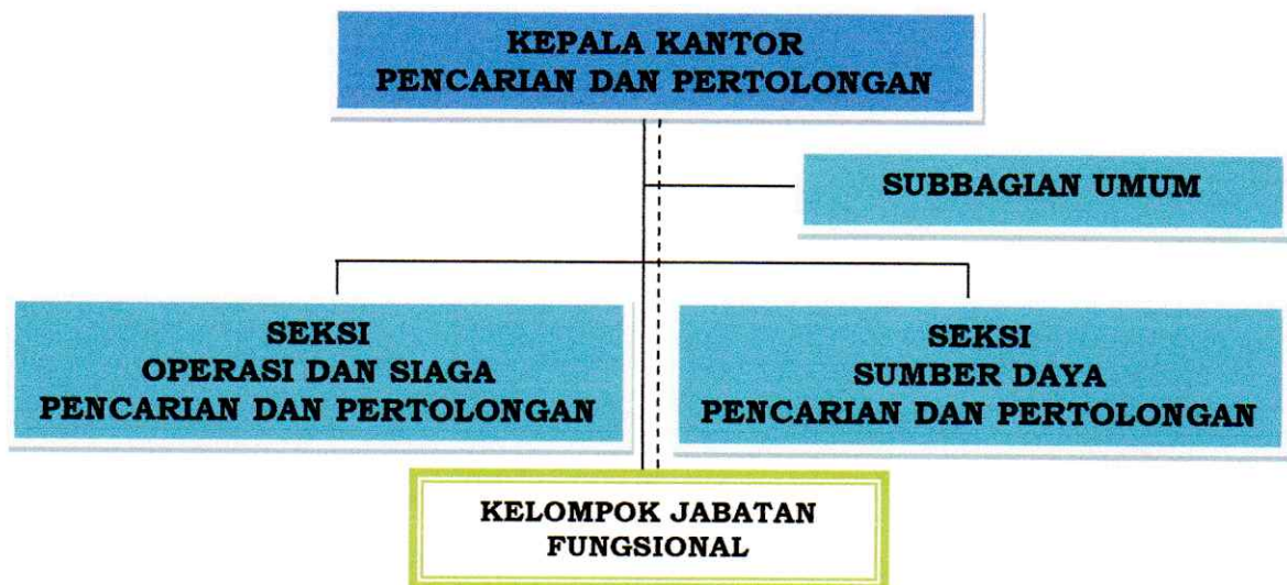
Gambar 1. Struktur Organisasi Kantor Pencarian dan Pertolongan Kelas A Banda Aceh

Berikut susunan organisasi Kantor Pencarian dan Pertolongan Banda Aceh: